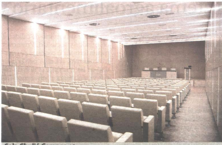
Sala Chuliá Campos. LP