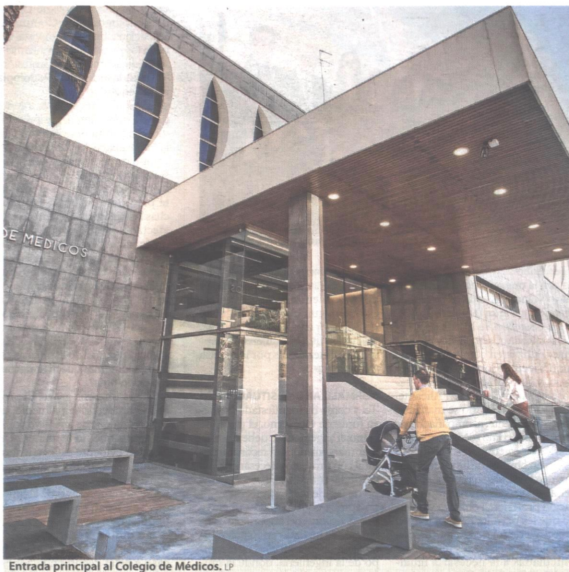
Entrada principal al Colegio de Médicos. LP

tica, imagen y sonido. La calidad de la acústica se controla mediante la utilización de revestimientos y falsos techos, todo ello integrado según una estética contemporánea y atractiva.