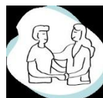
Grupos de Apoyo Mutuo