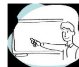
Formación y educación