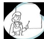
Cursos de Autocontrol del INR